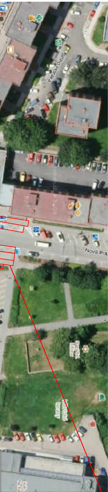
PŘEHLEDNÁ SITUACE UMÍSTĚNÍ STAVBY